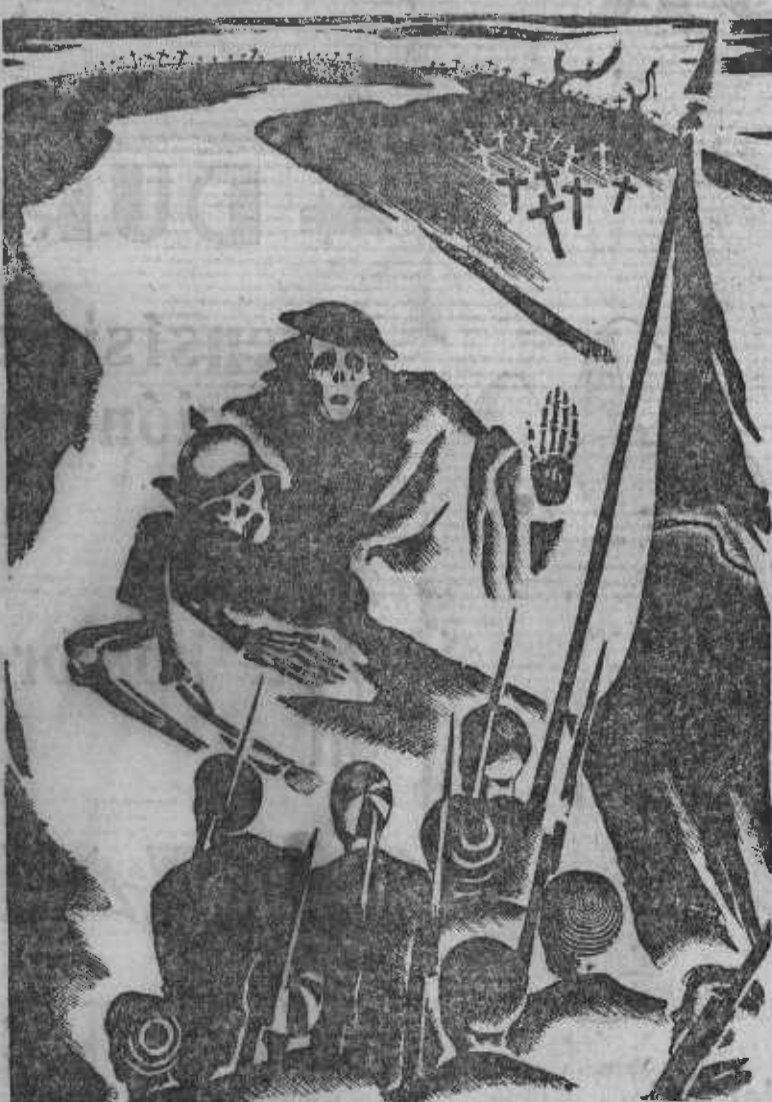
Los muertos de la gran guerra gritan a los soldados de la próxima: ¡No pasaréis!

Se admiten suscripciones a EL SOCIALISTA a 2,50 pesetas en Madrid y a 3 pesetas en provincias.