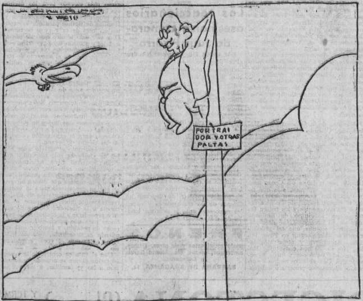
—¡Ay! Si yo no he pactado con las derechas; no he hecho más que pedir sus votos... y disolver las Cortes.