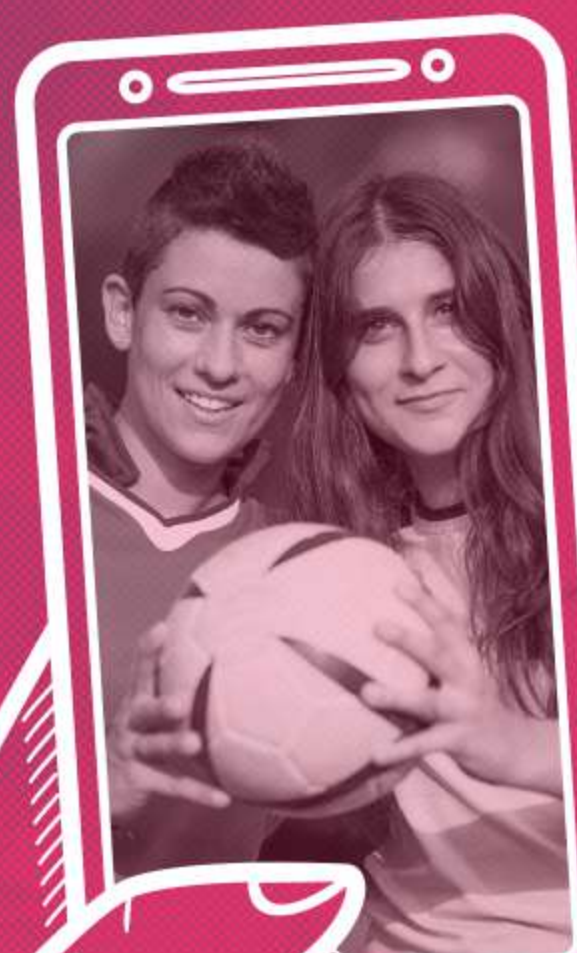
FOTO CLUB DE FÚTBOL "EL CLUB DE MIS AMORES NO ME PODÍA FALLAR, AQUÍ ESTAMOS TODOS POR EL APRUEBO. AL RECHAZO LE GANAMOS POR GOLEADA"

TWITTER @FPD_CL INSTAGRAM @FPDCHILE FACEBOOK.COM/FPDCHILE