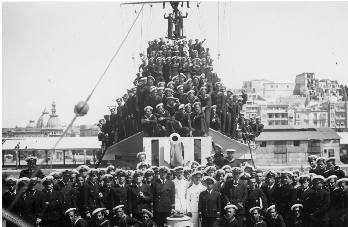
Destructor Almirante Valdés. España. Ministerio de Cultura y Deporte. Centro Documental de la Memoria Histórica