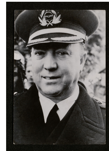
Antonio Camacho Benítez. Imagen procedente de la Biblioteca Nacional de España

sublevaron pero tres se opusieron. El 29 % de la oficialidad en activo no se sublevó, frente a un 36% que sí lo hizo. La diferencia la marcó el 35% restante que abandonó la zona republicana. Esto significó un desequilibrio de más de tres a uno en cuadros de Estado Mayor en el territorio franquista, factor clave de su superioridad militar a lo largo de la guerra. Los militares que se mantuvieron en su posición anterior al golpe, sufrieron las consecuencias directas: algunos fueron juzgados y ejecutados. Otros fueron encarcelados o se marcharon al exilio al término de la guerra. Todos ellos, a pesar de su brillante trayectoria profesional, fueron expulsados del Ejército. Víctimas de la guerra y de la dictadura, cayeron en un olvido que esta exposición trata de paliar a través de 30 trayectorias representativas de todo un conjunto generacional.