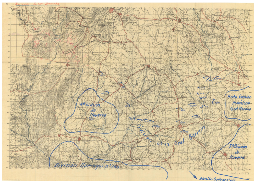
Posiciones de Brunete. España. Ministerio de Defensa. AGMAV 1805/8

La mayor parte de la Guardia Civil apoyó el golpe y siguió las instrucciones reservadas dadas por Mola: abandonar las comandancias pequeñas y concentrarse en las capitales de provincia. Desconcertadas, las autoridades republicanas confiaron en poder mantener la situación con la Guardia de Asalto. Contaron además con una parte de la fuerza aérea que mantuvo los aeródromos en el entorno de Madrid, y con la Marina, que consiguió bloquear el Estrecho de Gibraltar, retrasando el trasvase de las tropas marroquíes de Franco a la Península. A pesar de todo, el 21 de julio, los militares sublevados controlaban ya una buena parte del territorio español: todo el protectorado de Marruecos, las islas Canarias y Baleares (a excepción de Menorca), una gran parte del oeste y centro peninsular (Navarra, Álava, Castilla y León, Galicia, la mitad de