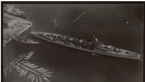
Crucero Libertad.