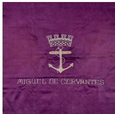
Banderín Quinta Compañía de marinería. España. Ministerio de Defensa. MNM 4963