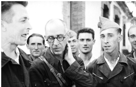
General Mangada.

Tal y como estaba previsto, la sublevación comenzó el 17 de julio de 1936 en el Protectorado Español de Marruecos. Al día siguiente, el general Francisco Franco volaba de incógnito desde Canarias a Tetuán para dirigir los movimientos de la pieza clave del pronunciamiento: el Ejército de África. Las horas y días siguientes fueron decisivos para el triunfo o fracaso del golpe. El plan diseñado por el General Mola se puso en marcha y la rebelión militar estalló simultáneamente en la Península.