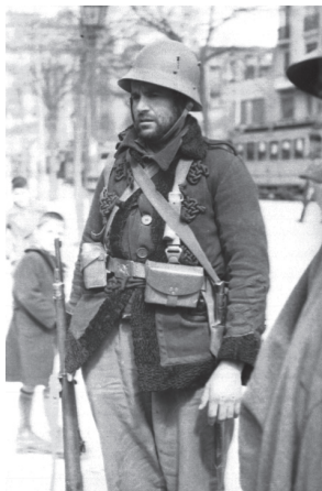
Movilización general frente al edificio de Telefónica. Madrid.