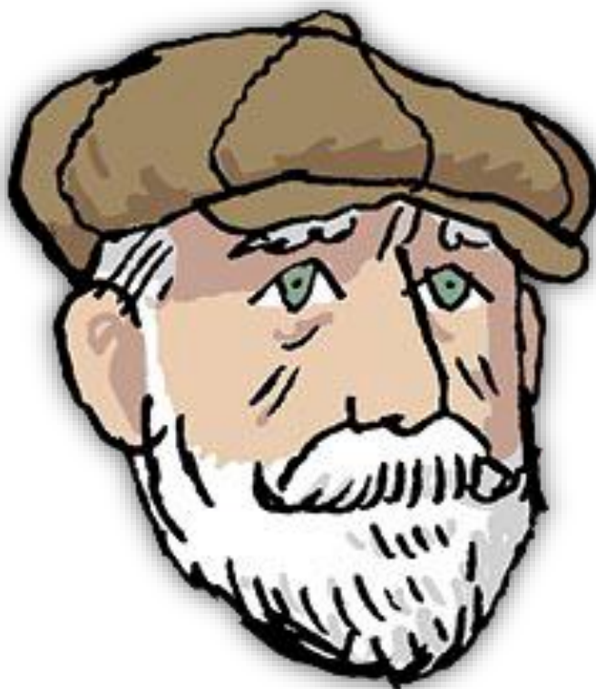
Ilustración del cómic de Alfonso Zapico. La palabra encendida de Pablo Iglesias . Separata del número 140 de Letra internacional (2024)