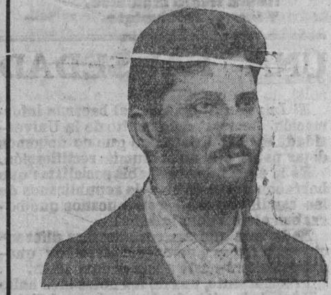
FELIPE TURATI Diputado por Milán (7.º distrito), leader de la minoría socialista.

A nosotros también nos va pareciendo intencionado el incendio. ¿Por qué no decirlo? Conocemos los procedimientos a que suelen apelar los explotadores de la clase obrera cuando en los conflictos huelguísticos llevan las de perder.