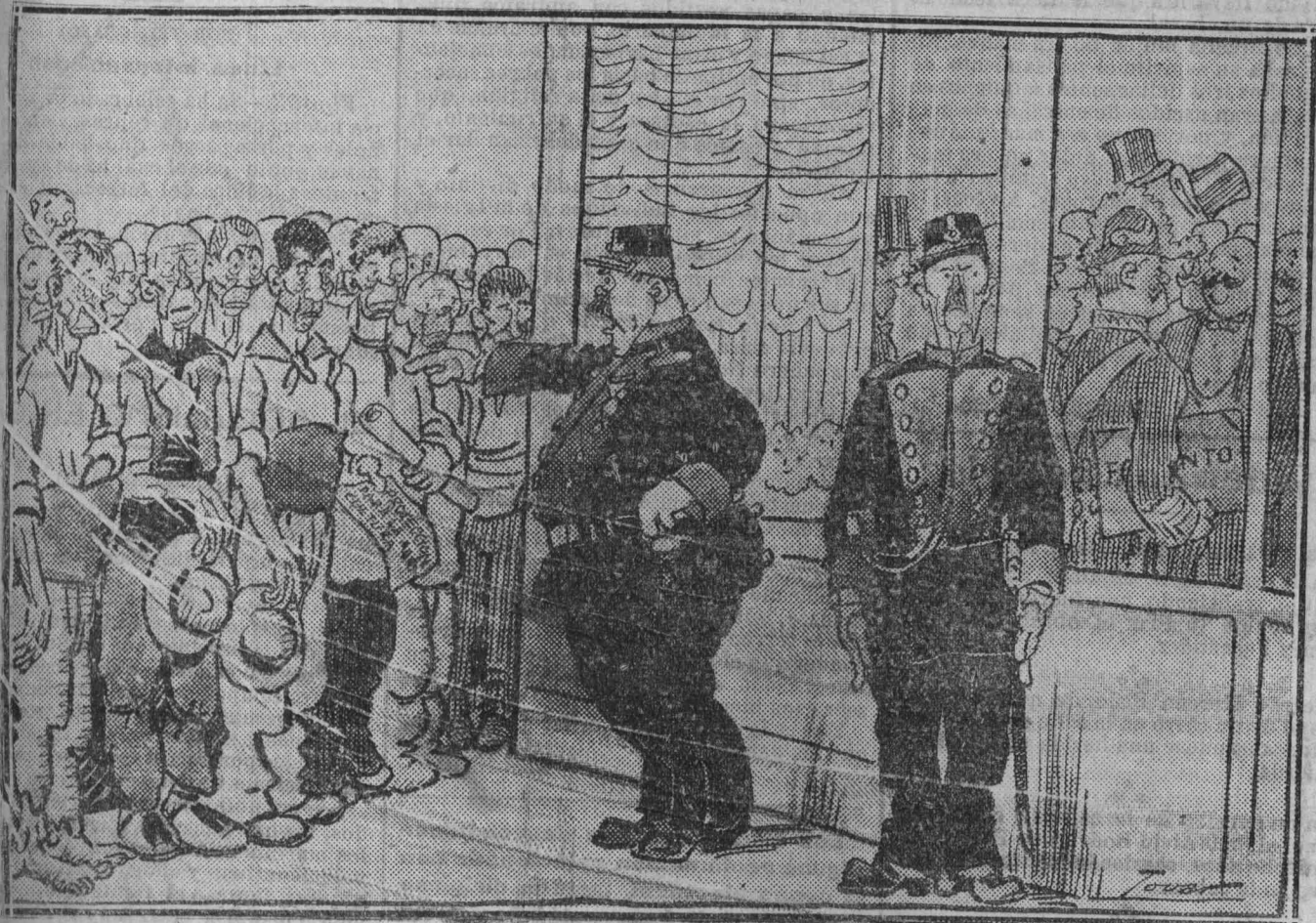
EL GUARDIA.—El señor ministro ha venido aquí á que lo banqueteen y le hagan honores, y no á cir lamentaciones y calamidades. Conque ¡largo de aquí, pobretes agricultores!