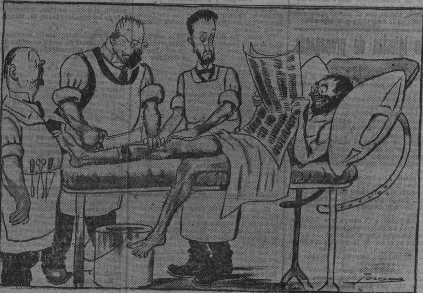
EL DOCTOR.—¿Qué, ¿le hemos hecho á usted mucho daño? EL PACIENTE.—En comparación con lo que estoy leyendo de Jalón, como si me hubiesen ustedes hecho cosquillas.

¿qué es mas que dinamita que puede estallar cualquier día allí donde se reúnen 15.000 hombres?