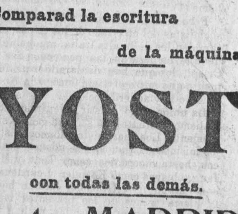
Enseñanza de mecanografía.