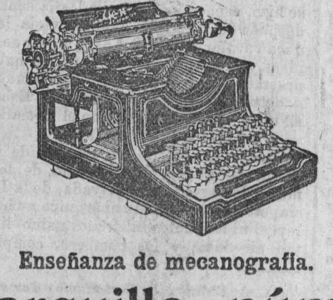
Enseñanza de mecanografía.