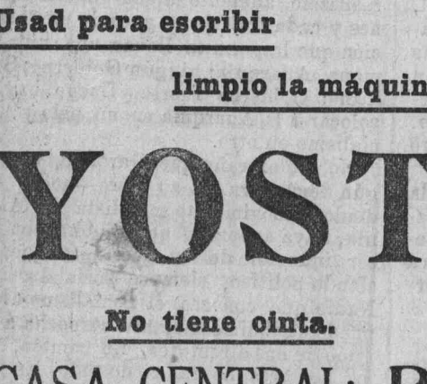
Enseñanza de mecanografía.