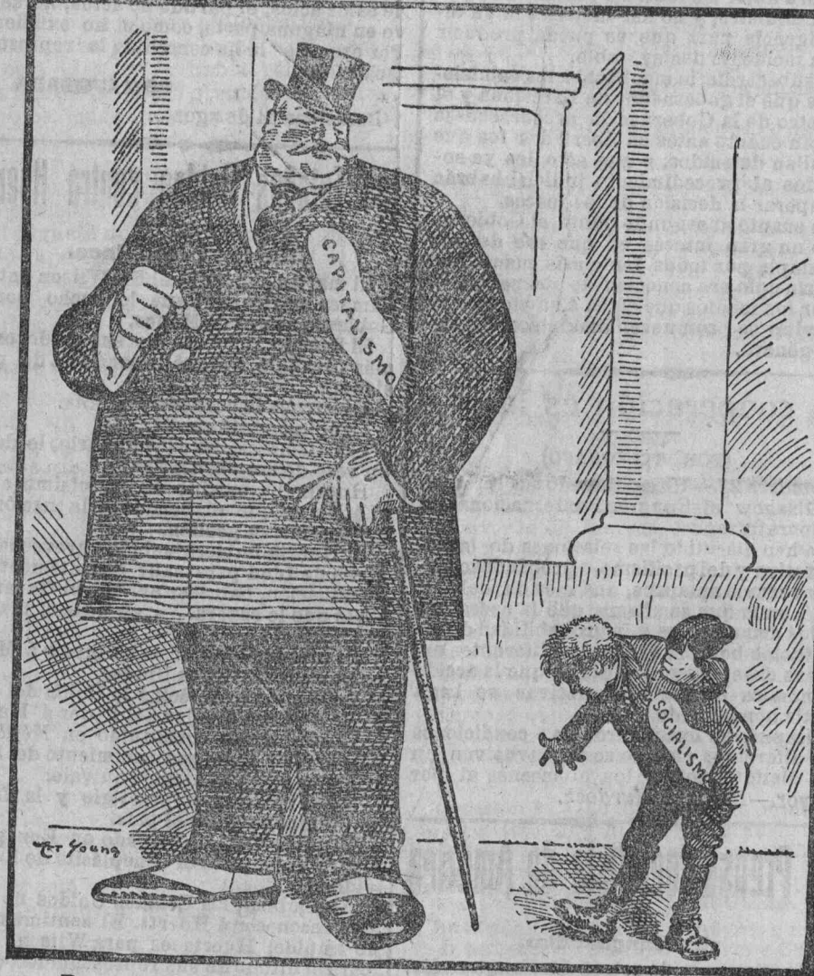
— Pero, ¿qué quieres tú, arrapiezo? — Yo..., amigo mío, ¡lo quiero todo!