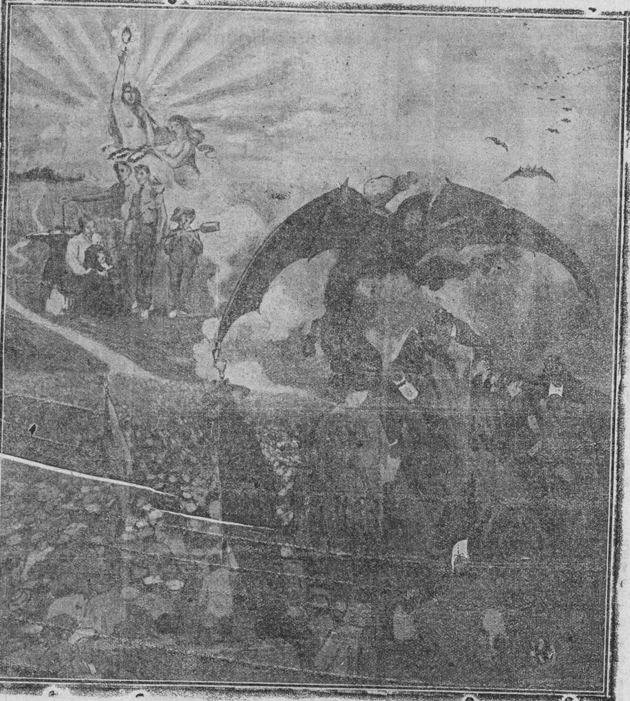
Alegoría que publicará en el próximo número extraordinario de Primero de Mayo 'El Mundo Obrero', de Alicante.

Carbonería cooperativa de los cocheros de Madrid Travesía de San Mateo, núm. 6.