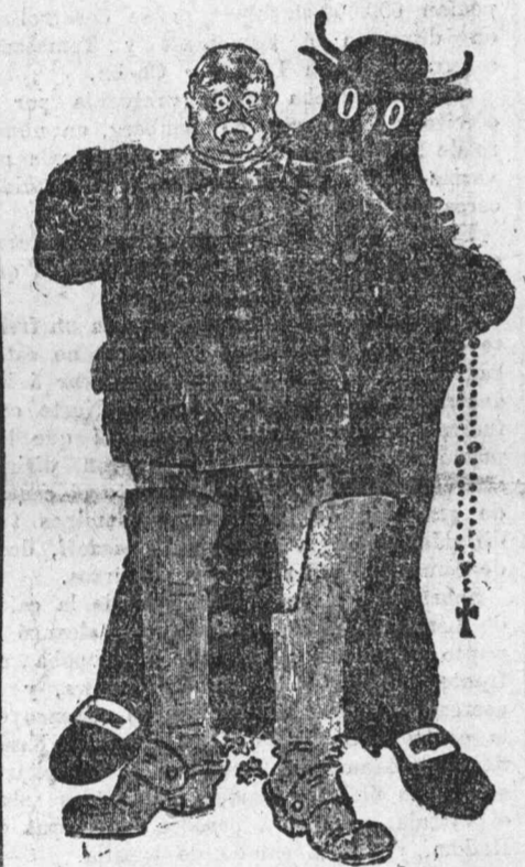
—Mira; ¡qué horror!... ¿No te espanta nuestra obra?