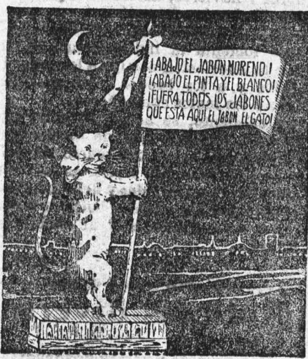
De venta en las Cooperativas Socialistas.