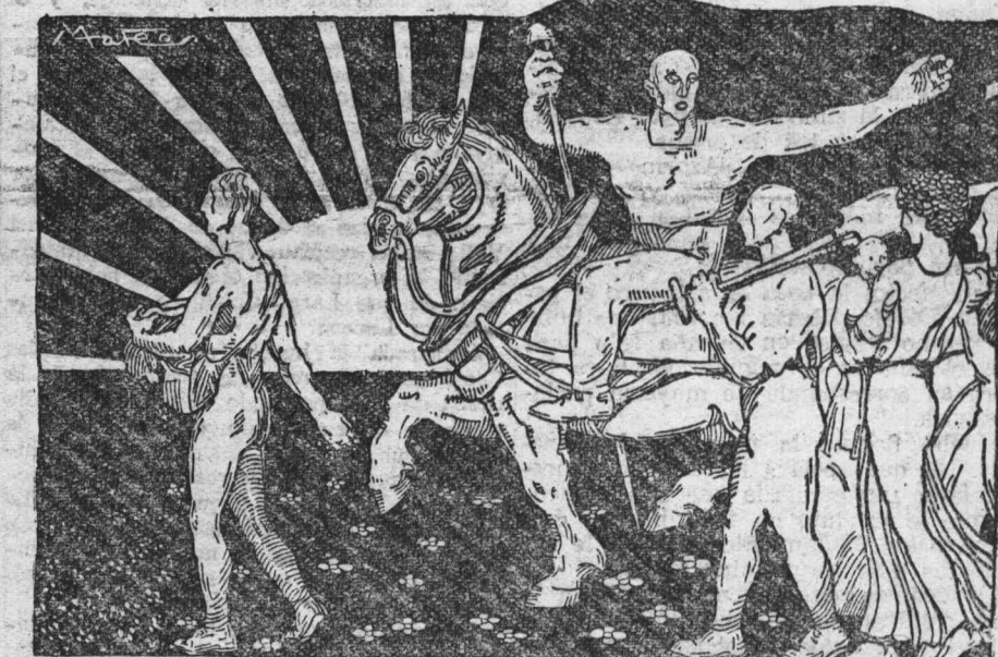
EL TRABAJO SEA, POR LO MISMO, LIVIANO Y ALEGRE COMO UN GOCE

manera que toda legislación, no ya sobre las ocho horas, sino sobre cuatro o dos, está de más. El trabajo es una carga demasiado pesada para lo que, con imagen poética, podríamos llamar sus alas de mariposas negras.