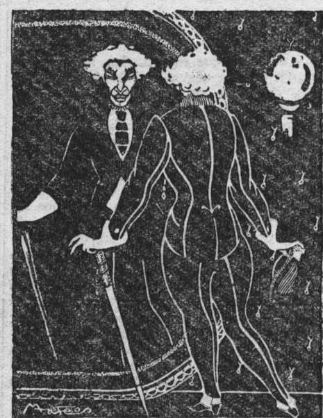
“EL NIÑO BIEN” ES UNA DE LAS ESPECIES MEJOR DEFINIDA

manera que toda legislación, no ya sobre las ocho horas, sino sobre cuatro o dos, está de más. El trabajo es una carga demasiado pesada para lo que, con imagen poética, podríamos llamar sus alas de mariposas negras.