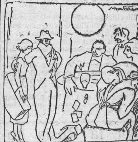
SON FLORACIONES ESPECIALES QUE NECESITAN DEL INVERNADERO DE LA BURGUESIA

Ellos sacan provecho de sus conatinencias con las casas de juego y otras cosas pecores, con negocios sucios y con amistades equívocas. La