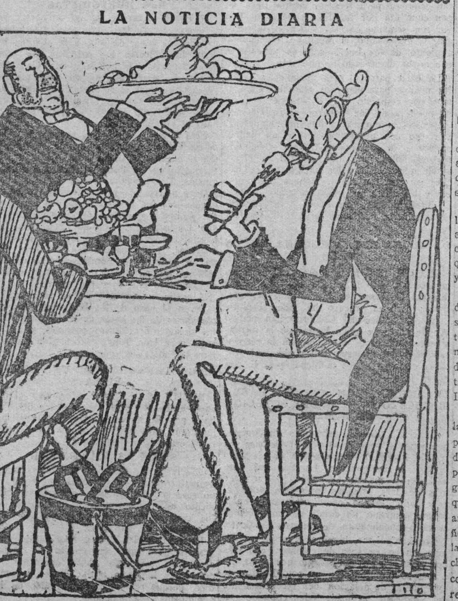
«El Gobierno se ocupa de la cuestión de subsistencias...»