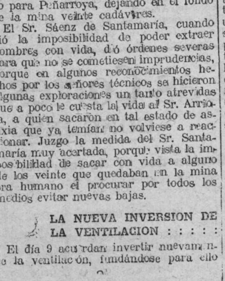
LA NUEVA INVERSION DE LA VENTILACION

cima, pues como la ventilación tenía su salida por el pozo siete, en el momento en que se colocan en la parte posterior al fuego, ya no corrían riesgo ninguno.