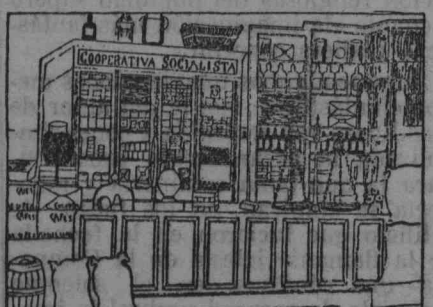
El primer despacho que tuvo la Cooperativa en el Centro de Relatores.