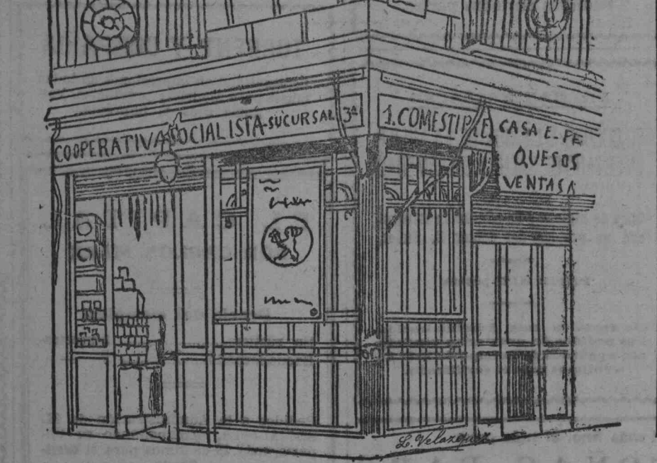
La tercera sucursal: General Martínez Campos, 1, y glorieta de la iglesia, número 3.

—Con mucho gusto. Cuando se repartieron los beneficios hubimos de