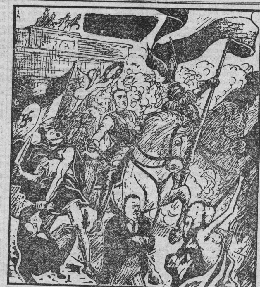
LOS IMPERIALISTAS ALEMANES.—«Simplicissimus», de Munich, ha reflejado en esta regocijante caricatura la victoria que las huestes del viejo kaiser se atribuyen en el nuevo Parlamento. Von Hitler, al frente de los nacionalistas, hace su entrada en Berlín, llevando delante, cargado de cadenas, al presidente Ebert.

El Pleno de la Unión General de Trabajadores de Vizcaya se reunirá el día 15 en el Centro Obrero.—LA LUCHA.