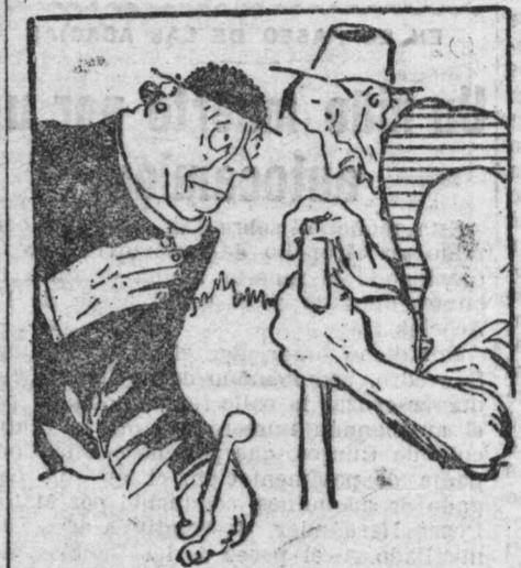
—Hijo mío, no te desesperes por el hambre y la fatiga. Esto es el orden social, y nosotros estamos para defenderlo.