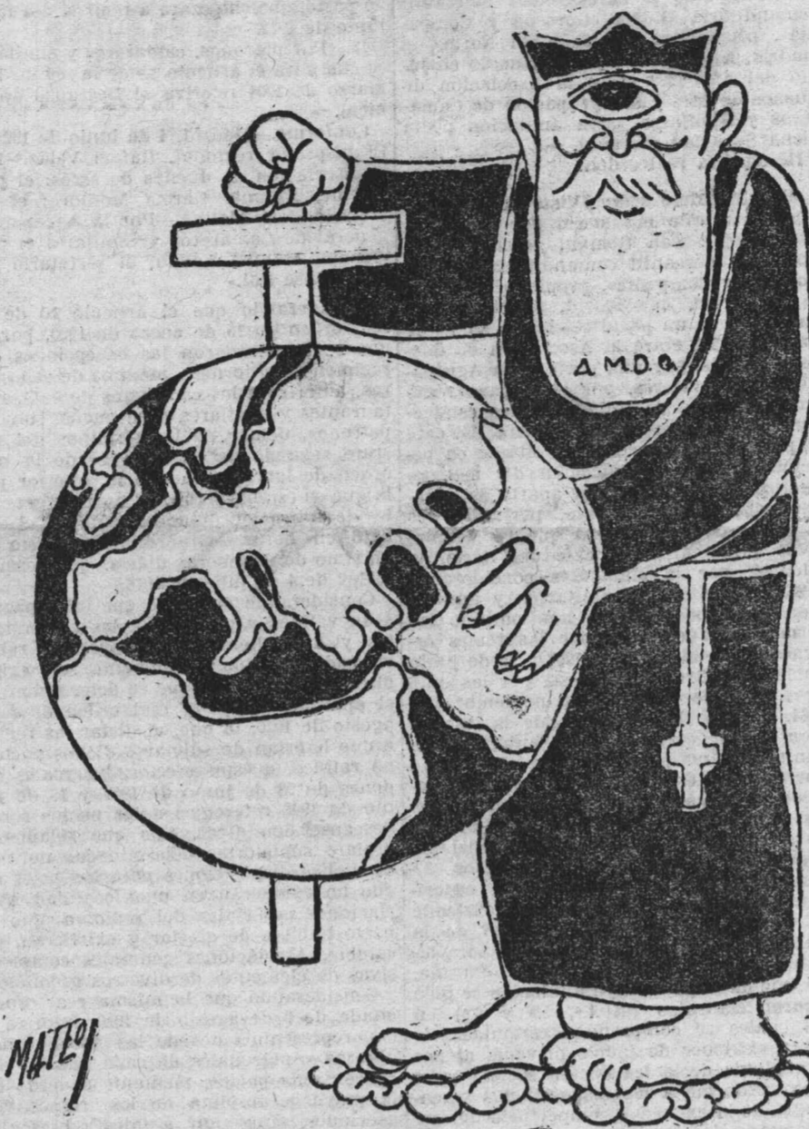
-- Si, la tierra se mueve; pero a mi impulso.