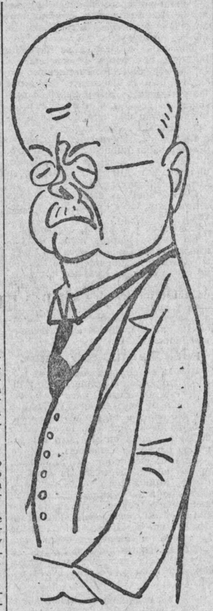
El doctor Marx, jefe del Gobierno alemán.