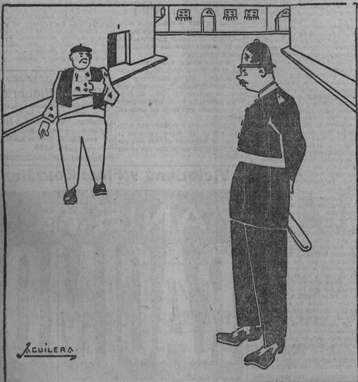
REFLEXIONES DE UN GUARDIA.—Verdaderamente, no merece la pena de haber visitado París, Londres y Berlín, para tener tan pocos animales a quienes proteger.