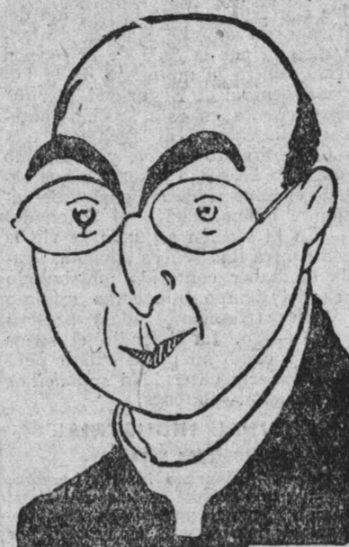
Monseñor Seipel, jefe del Gobierno austriaco.

LONDRES, 29.—El camarada Cook, secretario de los mineros, ha dicho que la resolución del Gobierno prohibiéndole a él y a otros compañeros hablar a los huelguistas, ha favorecido la causa de los trabajadores más que todos los discursos que se pudiese pronunciar.