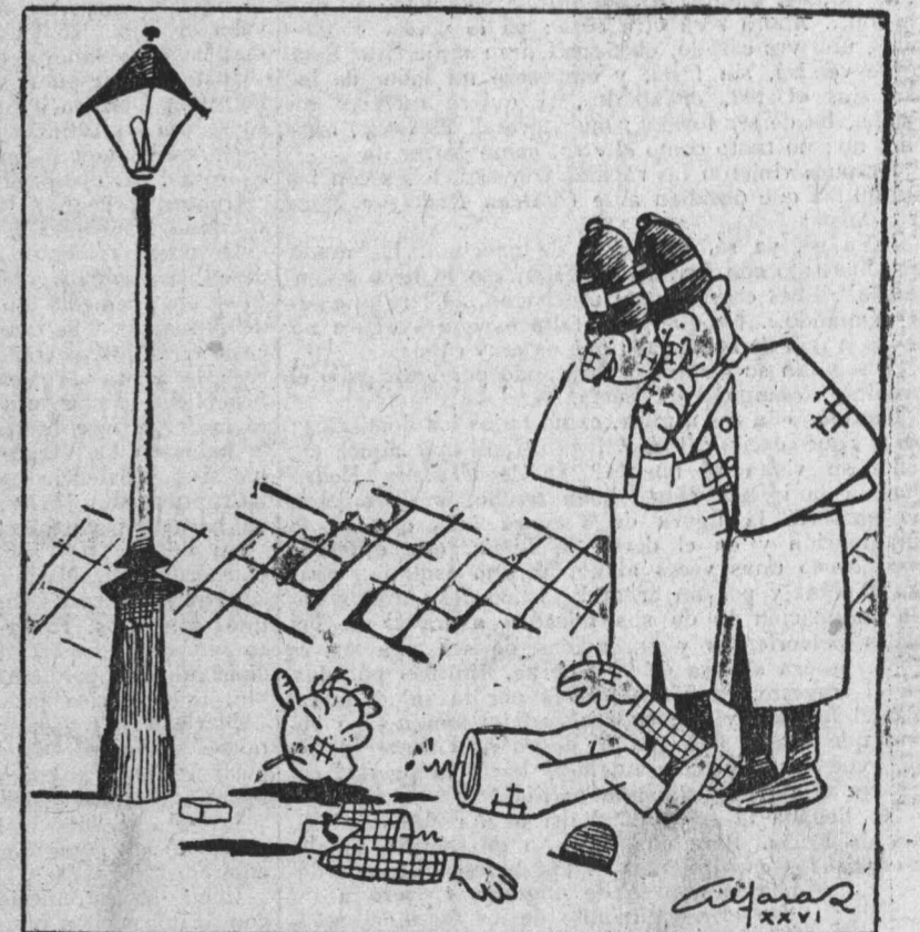
— ¡Un hombre destrozado! ¿Cómo habrá sido? — Seguramente que habrá encendido una cerilla de madera.