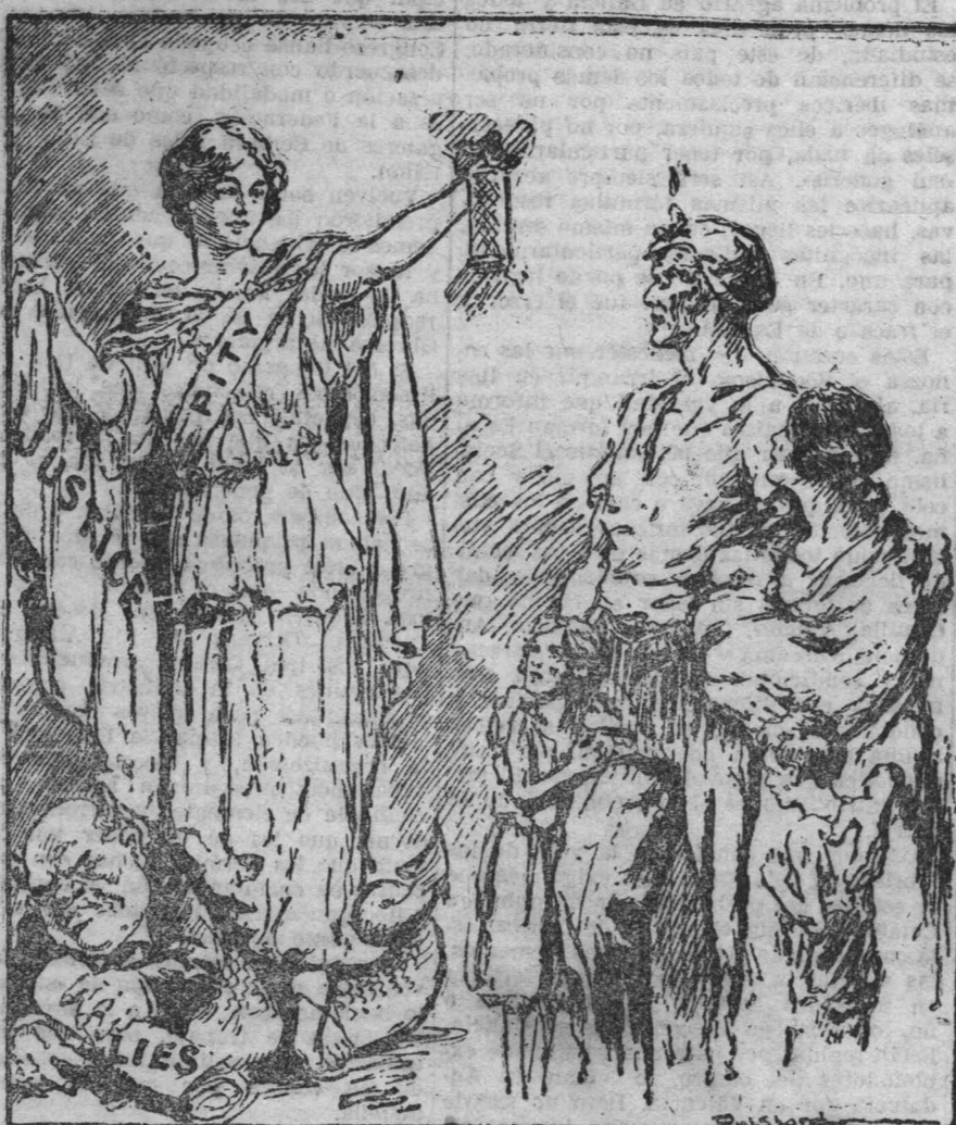
En Inglaterra surgió la idea de celebrar, a beneficio de los niños mineros el Día de la Lámpara, en el cual vendéanse minúsculas lamparitas similares a las que usan los trabajadores del subsuelo. En Londres alcanzó tanto éxito, que se va a celebrar por segunda vez. He aquí un dibujo que propaga dicho Día. La Dama de la Lámpara, que simboliza la Justicia y la Piedad, aplasta a los reptiles embusteros que quieren desfigurar la lucha, y al mismo tiempo alumbrará al minero y a su familia, como incitándolos a tener esperanza.

El Comité decide tomar inmediatamente y en todos los países cuantas medidas sean posibles a fin de que los obreros se nieguen a producir carbón destinado al objeto expresado más arriba. Y resuelve además que se preste la ayuda financiera más eficaz posible a los mineros británicos en su lucha contra el envilecimiento de sus condiciones actuales de existencia.»