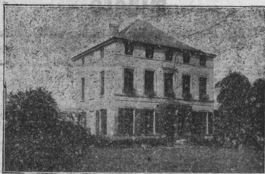
PABELLON PRINCIPAL DE LA ESCUELA SUPERIOR OBRERA, DE BRUSELAS

2 de agosto de 1880.—Mueren en Madrid el autor dramático y erudito Juan Eugenio Hartzenbusch, que había nacido en 1802. Reveses de fortuna le obligaron en sus primeros años a abandonar los estudios y ganarse la vida en un taller de estampería, hasta que consiguió una plaza de taquígrafo temporero en la «Gaceta» en 1837. Antes de esto, ya había estrenado en 1837 un drama, que fué silbado furiosamente; pero aquel fracaso le sirvió de estímulo, y en 1837 estrenó su drama «Los amantes de Teruel», que le colocó a la altura de los primeros dramaturgos de su tiempo. A esta obra siguieron, entre otras muchas muy aplaudidas, el drama «La Jura en Santa Gadea» (1851) y las comedias de magia «La redoma encantada» y «Los polvos de la madre Celestina». Hizo varias refundiciones acertadas de los clásicos y tradujo muchas obras teatrales francesas e italianas. En 1862 fué nombrado director de la Biblioteca Nacional. La Academia de la Lengua le había nombrado individuo de número en 1847.