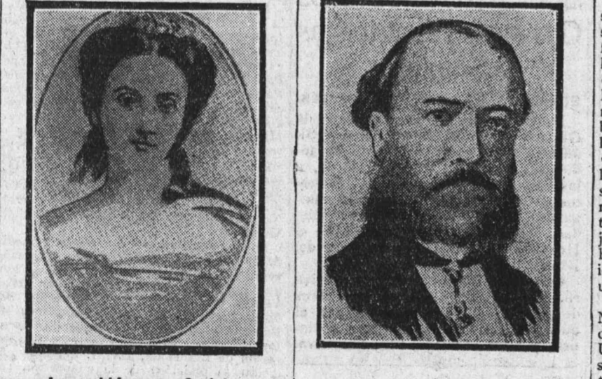
La archiduquesa Carlota.

El telégrafo ha anunciado la muerte, acaecida en Bruselas el 19 del corriente, de la princesa Carlota de Bélgica, hija de Leopoldo I y esposa que fué de Maximiliano, emperador de Méjico, fusilado en Querétaro en 1866, en unión de los generales Miramón y Mejía. La muerte ha puesto término a la vida de desdichas de aquella infeliz mujer, que también en las alturas suele albergarse el infortunio, aunque rara vez, y quizá por ello pareciera de mayores proporciones que cuando se ceba en los simples mortales.