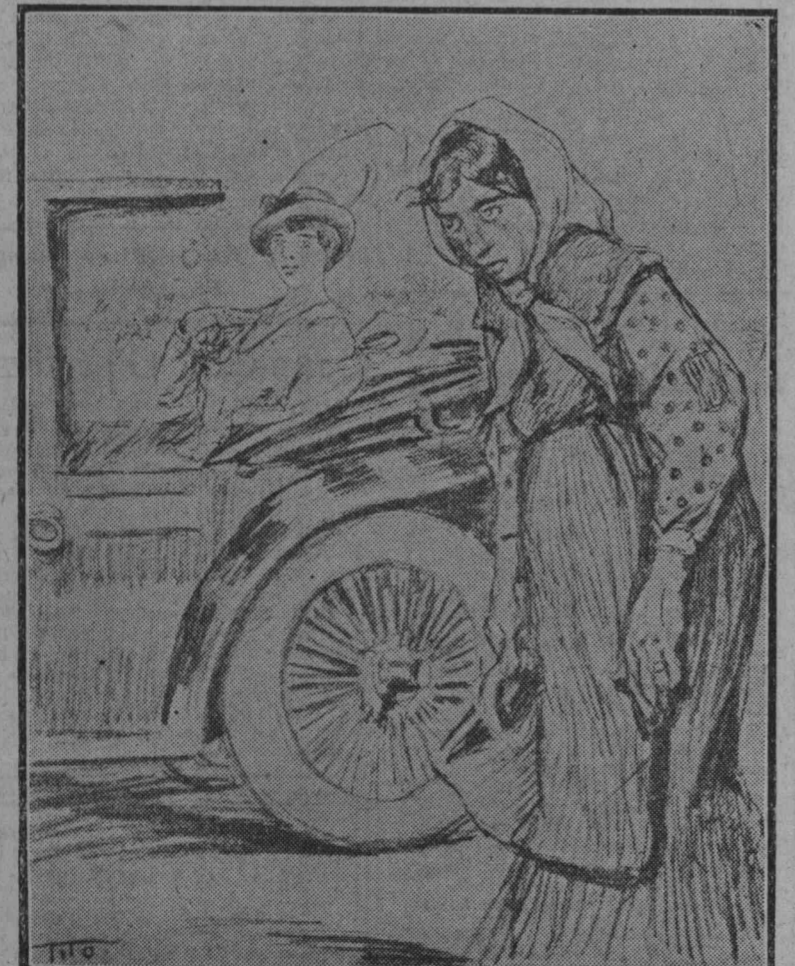
«El trabajo es la fuente de toda riqueza...»

Las páginas de este número han sido revisadas por la censura.