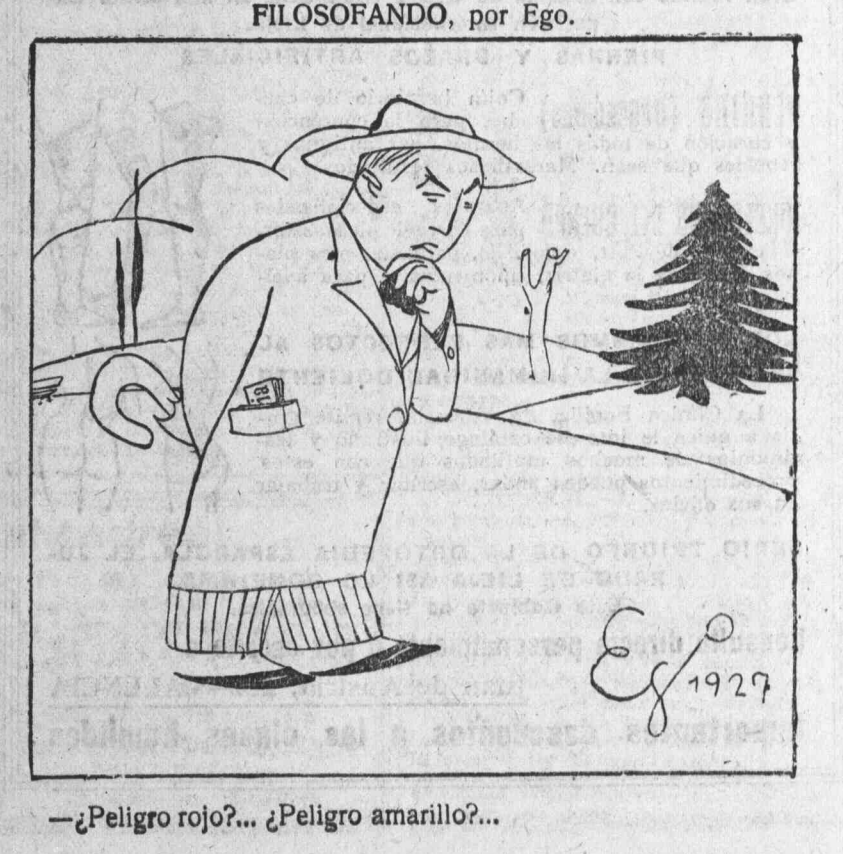
—¿Peligro rojo?... ¿Peligro amarillo?..