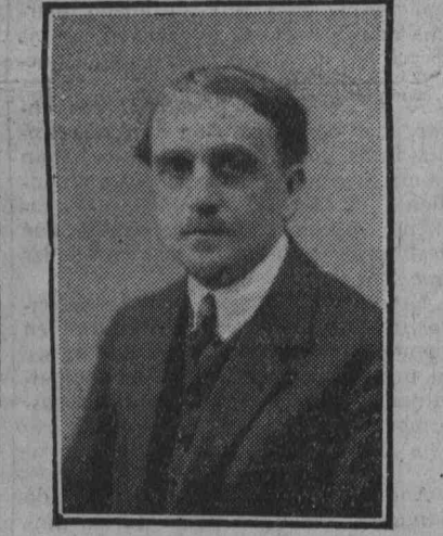
Camarada Paul Faure, secretario del Partido Socialista Francés, que tan brillantemente ha intervenido en el Congreso de Lyon.