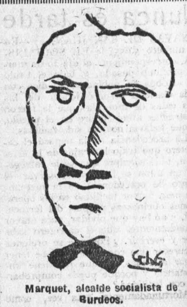
Marquet, alcalde socialista de Burdeos.