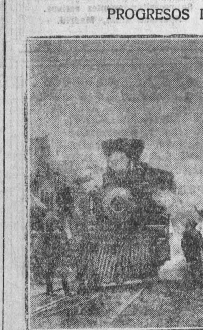
Los norteamericanos nos presentan una locomotora de 1869 y otra de 1927