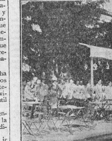
Un puesto de torrados

Los madrileños gustaban de ir allí a gozar de las abundantes sombras, llevándose las meriendas y sentándose en el suelo a comerlas. Los niños corrían y jugaban libre-