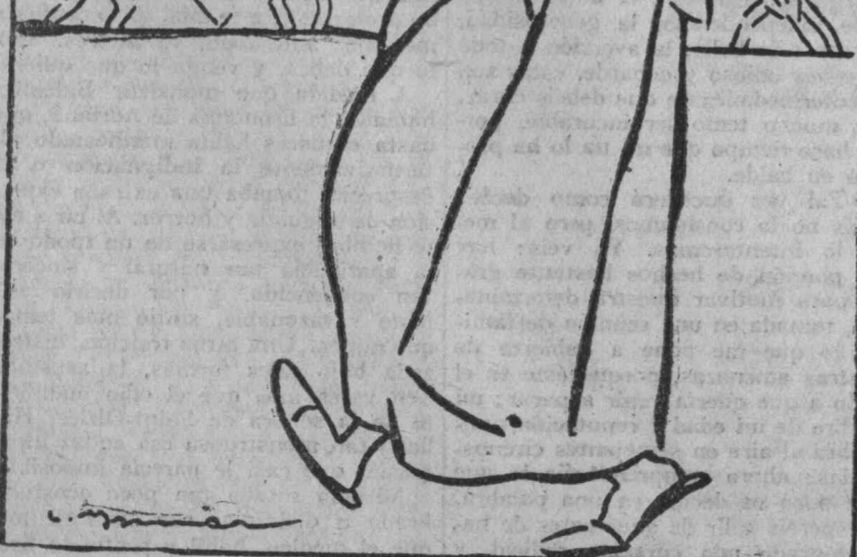
«¿Cuánto trabajan! Yo los bendigo... y paso de largo.»