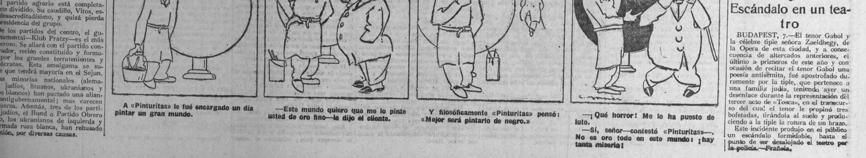
A «Pinturitas» le fué encargado un día pintar un gran mundo. —Este mundo quiero que me lo pinte usted de oro fino—le dijo el cliente. Y filosóficamente «Pinturitas» pensó: «Mejor será pintarle de negro.» —Qué horror! Me lo ha puesto de luto. —Sí, señor—contestó «Pinturitas».—No es oro todo en este mundo; ¡hay tanta miseria!

Profundamente modificado el cuadro director, se imprime a los actos colectivos la mayor sobriedad. Cierro que algunos dirigentes conserva-