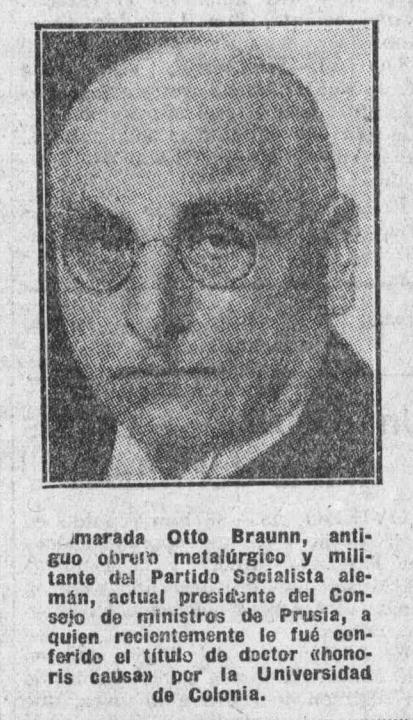
marado Otto Braun, militante del Partido Socialista alemán, actual presidente del Consejo de ministros de Prusia, a quien recientemente le fué conferido el título de doctor honoris causa por la Universidad de Colonia.