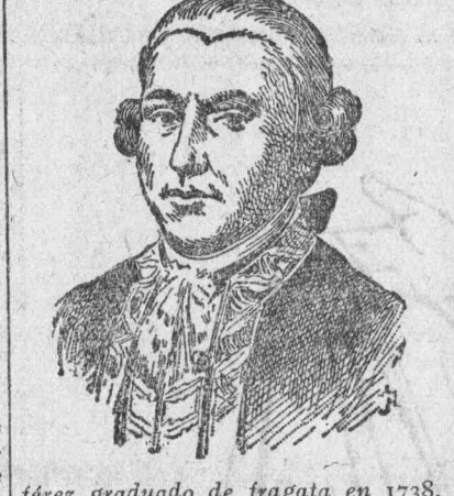
jérez graduado de fragata en 1738, y por sus grandes y apreciables servicios llegó a ser incorporado al cuerpo general de la Armada, llegando a capitán de fragata en 1762. En diferentes ocasiones venció a los piratas argelinos con fuerzas inferiores, siendo herido varias veces; por ello en 1769 fué ascendido a capitán de navío. Se distinguió en las costas del Mediterráneo por la activa persecución de los piratas, de los cuales rescató a muchos cristianos. En 1775 estuvo en la conquista de Argel, y en 1779 se le nombró comandante de las fuerzas navales destinadas al bloqueo de Jibraltar. Fué también jefe de la expedición naval que en agosto de 1783 atacó la plaza de Argel. Los achaques propios de la edad le obligaron a retirarse a su patria, en el que residió hasta su muerte.

29 de enero de 1797.—Muere en Palma de Mallorca el marino Antonio Barceló, nacido en la misma ciudad el 1 de octubre de 1717. Dedicado a la navegación, a los dieciocho años se le confió el mando de uno de los barcos que hacían la travesía entre las Baleares y la Península, y sostuvo con él más de una vez combate con los moros argelinos que infestaban las costas baleares. Esto le valió ser nombrado al-