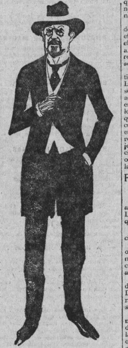
Emilio Vandervelde, que está recorriendo las ciudades argentinas de triunfo en triunfo.

más de sesenta fotografías de algunos líderes socialistas desaparecidos en el último interregno; otras del monumento a Matteotti en la Casa del Pueblo de Bruselas, de la Exposición de la prensa antifascista de Colombia, etcétera.