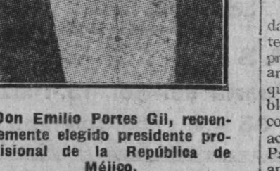
Don Emilio Portes Gil, recientemente elegido presidente provisional de la República de Méjico.

En todas las cuestiones suspendidas, incluyendo en ellas los problemas territoriales, la lógica se opone a la práctica para la comparación entre antes y después de 1914 y demuestra que, lo que parecía ilógico e irrealizable aparece ahora a los mismos lógicos y practicable. Es así que todos los actos que han seguido a Locarno, el Pacto de Kellogg, etc., deben tener su aplicación lógica.