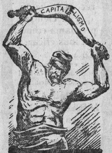
Miles son muchos; cientos de miles son fuertes; millones son invencibles. ¿Dónde estás tú? (De la Volkstimme, de Chemnitz.)

Y me parece un tremendo error el de aquellos compañeros que, escudados en la excepcionalidad del momento presente, creen no puede hacerse la