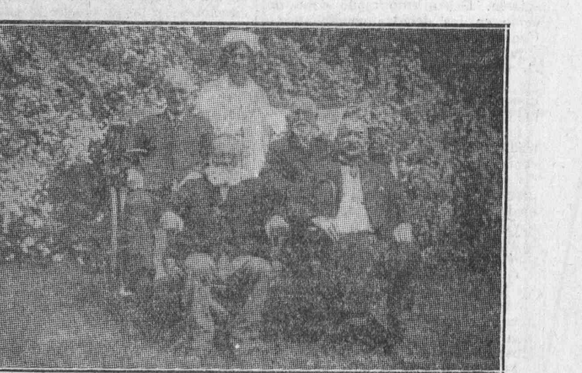
Grupo de camaradas jubilados por el movimiento obrero canadiense