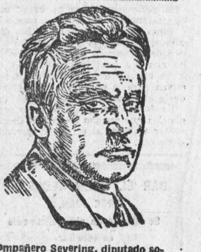
Compañero Severing, diputado socialista por el Norte de Westfalia.