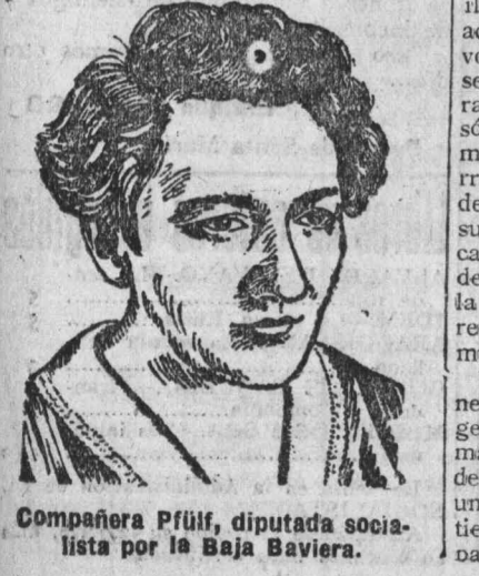
Compañera Pfliit, diputada socialista por la Baja Baviera.

LONDRES, 28.—El Consejo general de las Uniones obreras ha decidido obsequiar de nuevo con una medalla de oro a la obrera asociada que haya hecho más propaganda socialista durante el año último.—White.