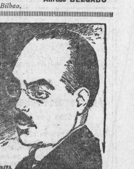
Rodolfo Hilferding, eminente socialista alemán, propuesto para ministro de Hacienda.