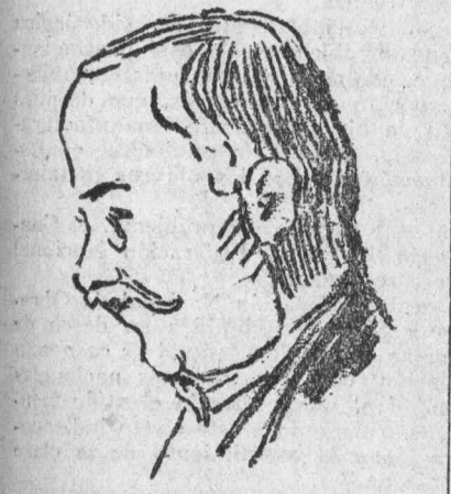
Punto del general Obregón hecho por Toral antes de cometer el atentado.

Hacia ya mucho tiempo que en el salón municipal no se había hablado de tan interesante problema. Y es precisamente al Municipio a quien le corresponde tratar y resolver dicho asunto.