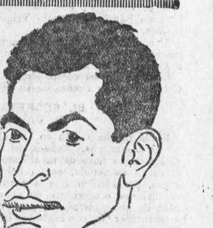
José de León Toral, autor del atentado en Méjico contra el general Alvaro Obregón.