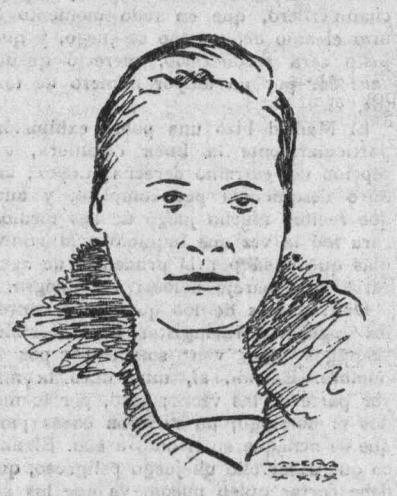
Susana Lawrence, secretaria parlamentaria del ministerio de Higiene, que ha sido elegida en Brighton presidenta del Partido Laborista. Es la primera vez que una mujer ocupa ese cargo.

Importante acto de propaganda minera NERVA, 7.—Organizada por el Sindicato Minero de Huelva se ha celebrado una importante reunión de propaganda, a la que han concurrido más de 3.000 mineros. Se trató de la elección de Comités paritarios en la industria minera, exponiéndose la táctica de la Unión General de Trabajadores, a la que pertenece la Federación Nacional de Mineros y de la cual deben salir los representantes de los trabajadores mineros en los Comités paritarios. El discurso de Agustín Marcos y los de otros camaradas produjeron extraordinario entusiasmo, que ha contribuido a que muchos trabajadores mineros pidan su ingreso en la organización. Se considera seguro el triunfo de los camaradas que designe el Sindicato Minero para ostentar la representación obrera en los Comités paritarios, que han de ser elegidos el día 10 del próximo mes de noviembre.—Elías.