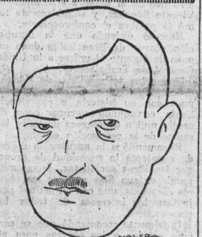
Eduardo Daladier, que ha renunciado a formar Gobierno, por la discrepancia con M. Briand.

BERLIN, 30.—Ha quedado disuelta la Dieta de Turingia, y las elecciones para su renovación se verificarán el 8 del próximo noviembre.