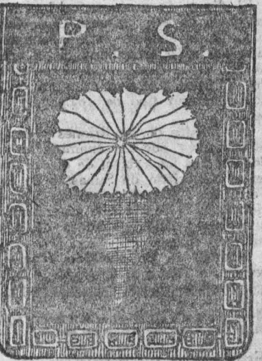
Distintivo del Partido Socialista Argentino.

Cuando esta correspondencia sea publicada en EL SOCIALISTA, posiblemente ya habrá tenido efecto en la ciudad de Buenos Aires el desfile y manifestación del Día de los Trabajadores, el Primero de Mayo. No obstante, interesa dar a conocer las condiciones en que este año ha dis-