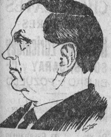
Tom Kennedy, de la Federación Social-Democrática y lord de la Tesorería en el Gabinete MacDonald.