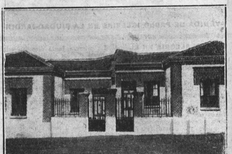
UN GRUPO DE DOS CASAS EN LA CIUDAD-JARDIN DEL NORTE (CUATRO CAMINOS)