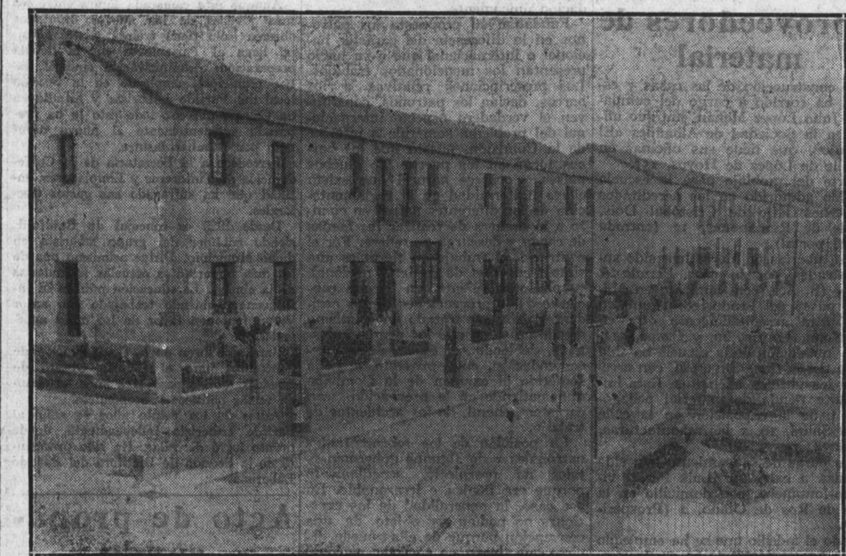
CALLE DE SANTIAGO PEREZ EN LA COOPERATIVA OBRERA DE CASAS BARATAS

Esto contribuye a hacer más agradable la estancia en la Ciudad-Jardín.