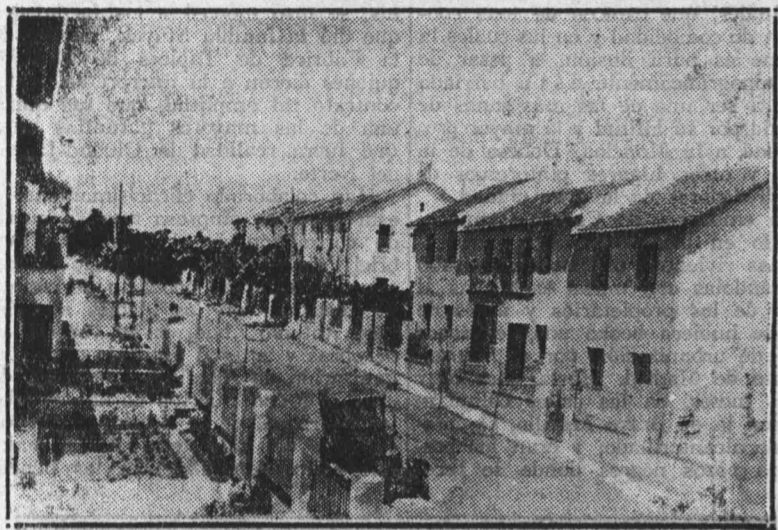
AVENIDA DE PABLO IGLESIAS EN LA CIUDAD-JARDIN