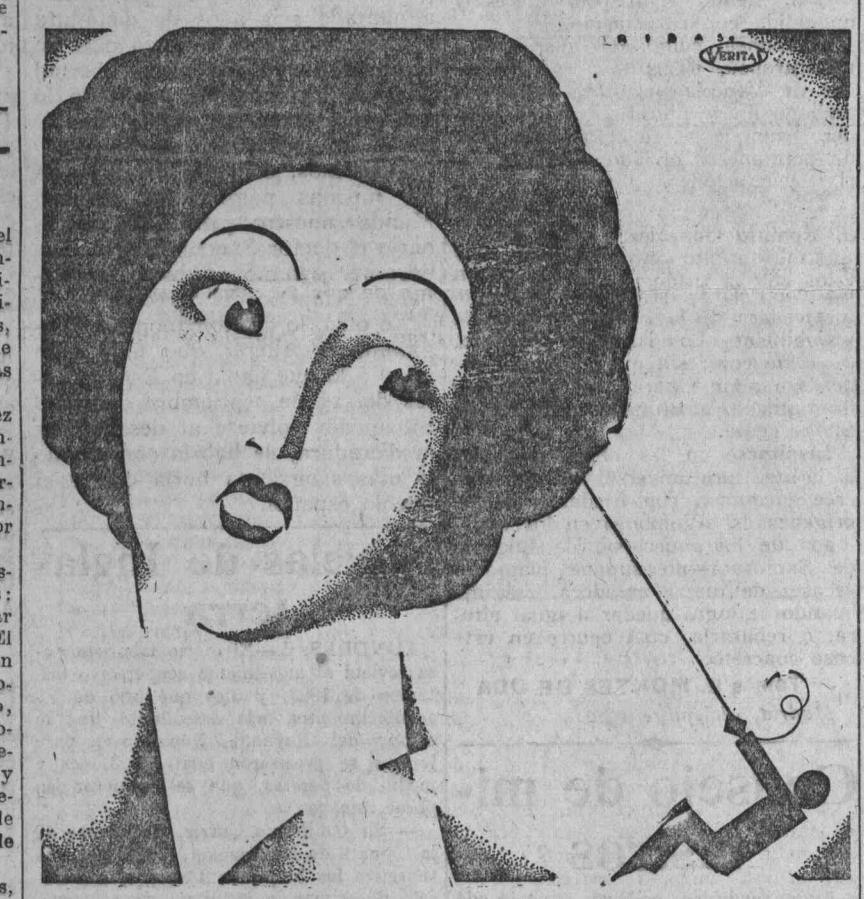
(De inserción obligatoria.)