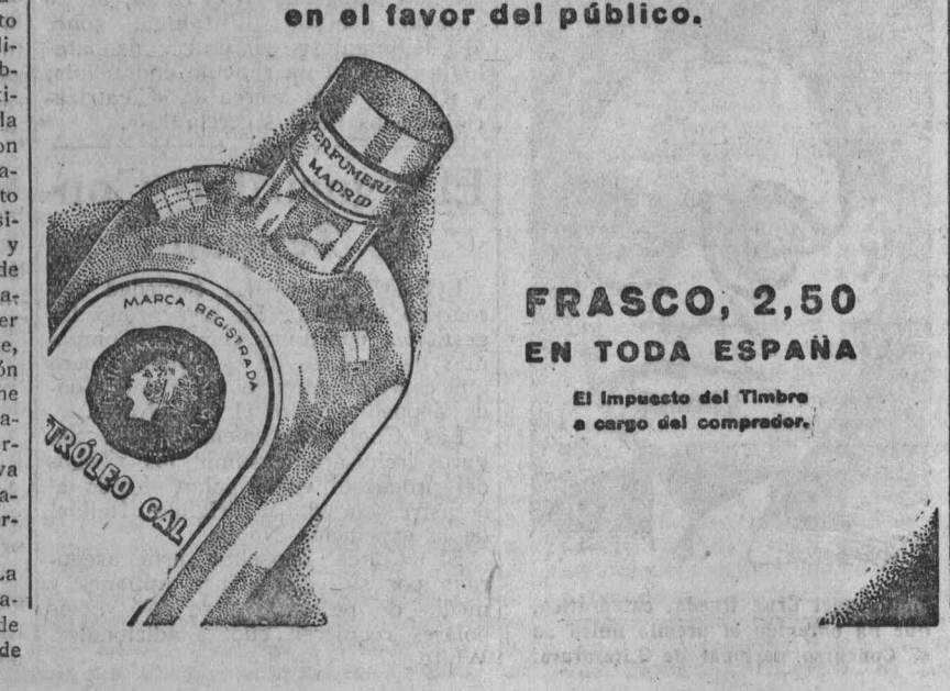
FRASCO, 2,50 EN TODA ESPAÑA. El impuesto del Timbre a cargo del comprador.

El peligro está ya conjurado. Esta loción higiénica de tocador, de perfume fresco y agradable, limpia bien el cuero cabelludo, elimina la caspa, causa inicial—las más veces—de la calvicie, y contiene la caída del pelo, dándole salud, fuerza y belleza.