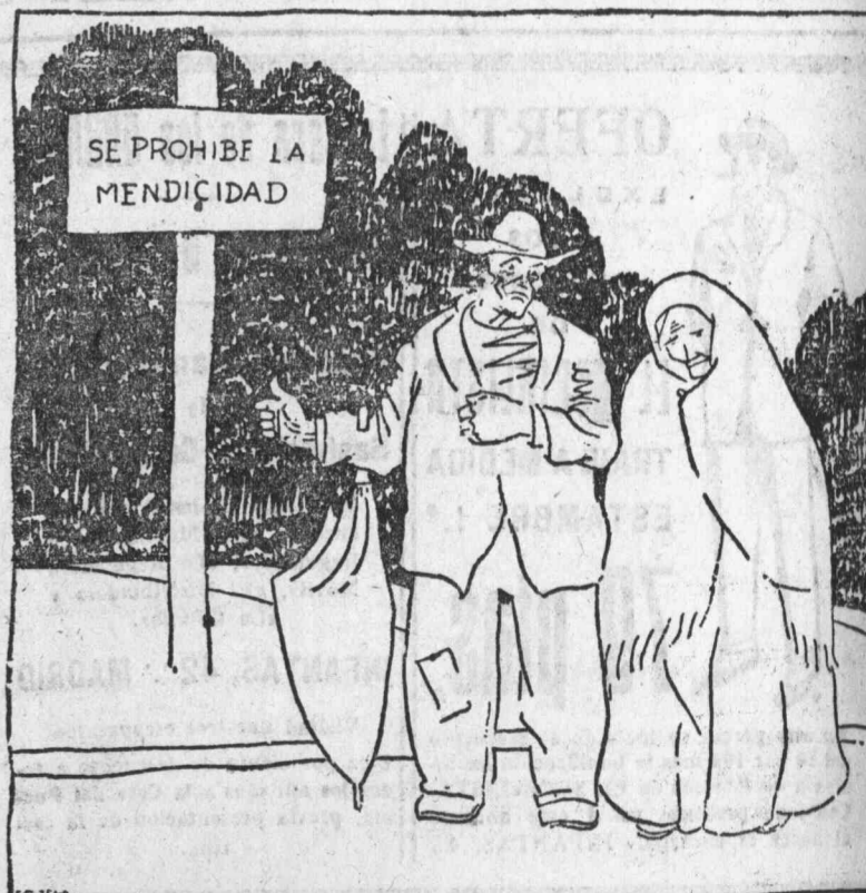
—Cualquier día prohíben la miseria. (De «Faro de Viron».)