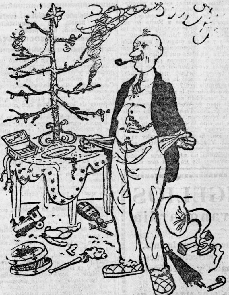
EL PADRE DE FAMILIA.—Me ha quedado sin un céntimo. ¡Cuánto me gustaría que me nombraran ministro de Hacienda! (Del «Vorwaerts», de Berlín.)