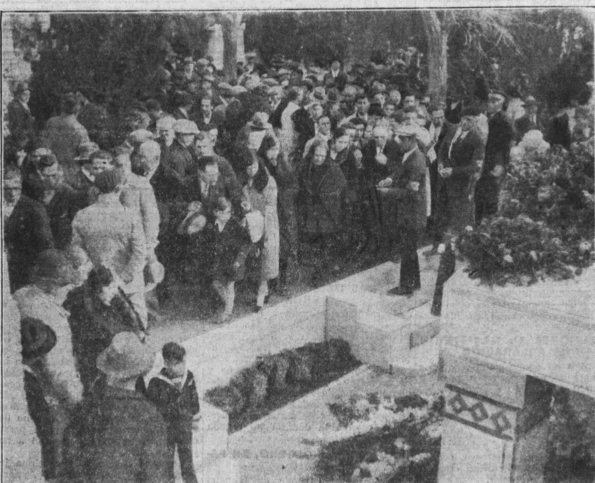
Ante la tumba de Iglesias: El alma del pueblo español se manifestó desbordante de ternura y gratitud hacia Iglesias en el desfile por el Cementerio Civil.