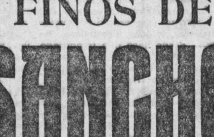
HERNAN CORTÉS, 7 - FUENCARRAL, 33 Y EN TODAS LAS COOPERATIVAS SOCIALISTAS