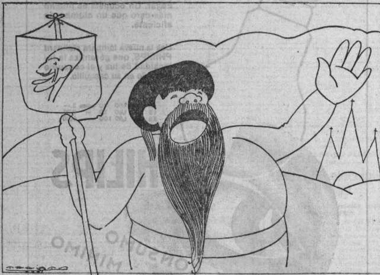
—¡El rey ha muerto! ¡¡Viva Cristo Rey!!