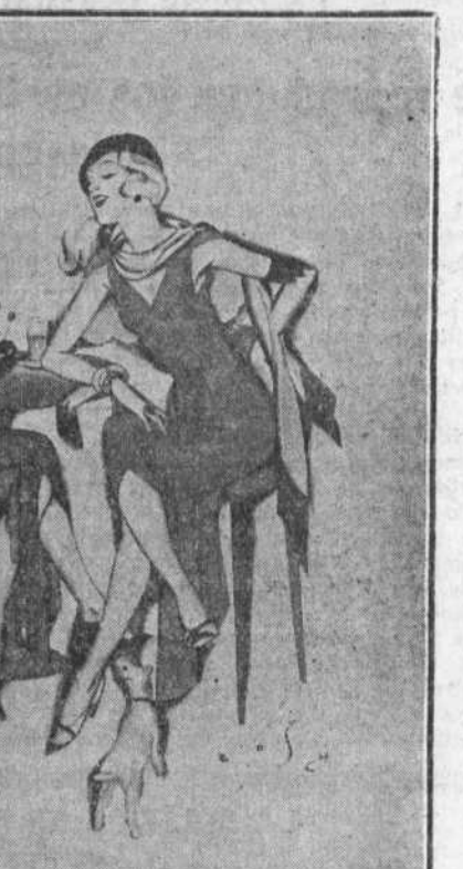
«Vermouth», una de las bellas estampas que expone Bosch en los salones de la Sociedad de Amigos del Arte.